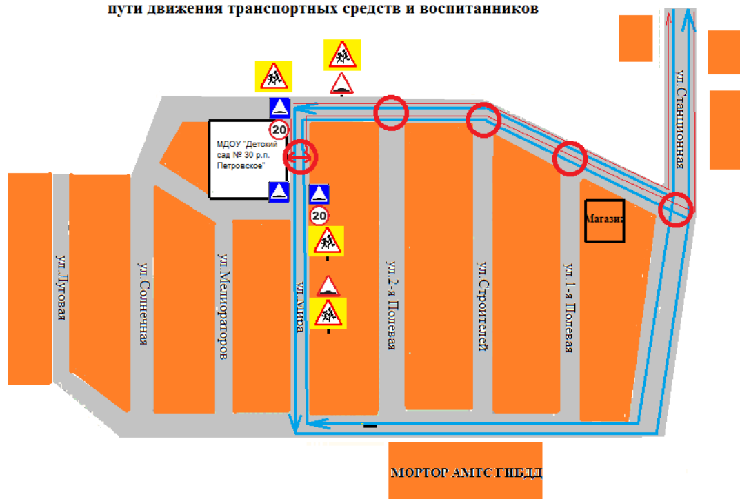
План-схема района расположения МДОУ «Детский сад № 30 р. п. Петровское», пути движения транспортных средств и воспитанников